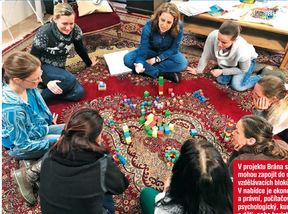
V projektu Brána se ženy mohou zapojit do několika vzdělávacích bloků. V nabídce je ekonomický a právní, počítačový, psychologický, kurz péče o děti, nebo baristický kurz.