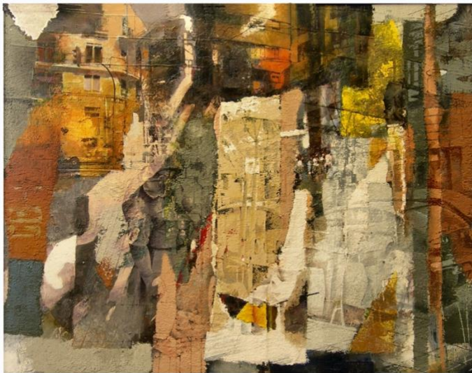
Autor: Manuel Domingo Castellanos