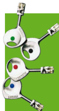
Cylindre 787 Z

Nos produits sont garantis 10 ans. Voir conditions auprès de votre Point Fort Fichet ou sur notre site www.fichet-pointfort.com