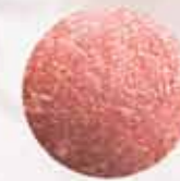
BLOOMING ROSE FM | r004