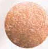
DELICIOUS PAPAYA FM | r003