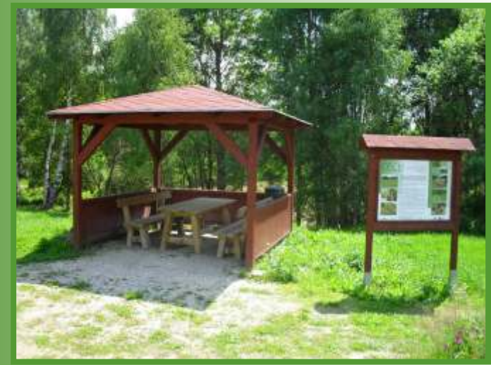
Odpočinkový altán na naučné stezce Cech Svatého Víta.

Naučná stezka na Cechu Svatého Víta leží na území bývalého vojenského cvičiště, které je v současnosti chráněno jako přechodně chráněné území. Specifikem území je řízené využití území pro motoristický sport. Pro veřejnost byla vybudována okružní stezka s dřevěným povalovým chodníkem v celkové délce 1,2 km. Součástí stezky je i několik altánů a vyhlídek. Návštěvníci mohou k pozorování ptáků a okolí využít velký srub.