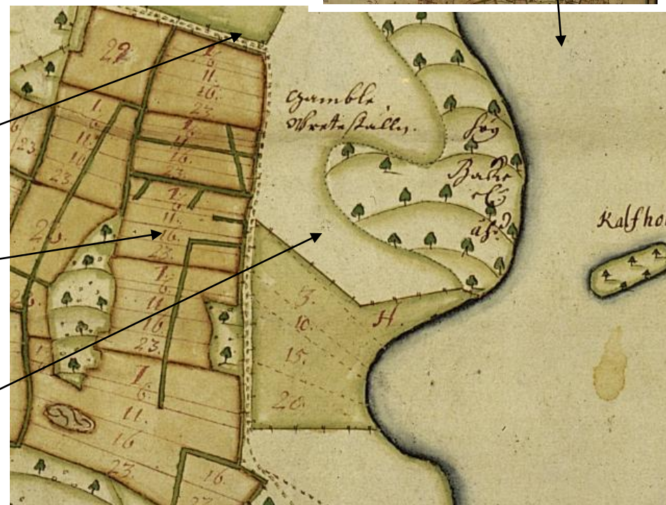
1685 års lantmäterikarta med Kalvholmen, Calmare hagen och byns åkrar