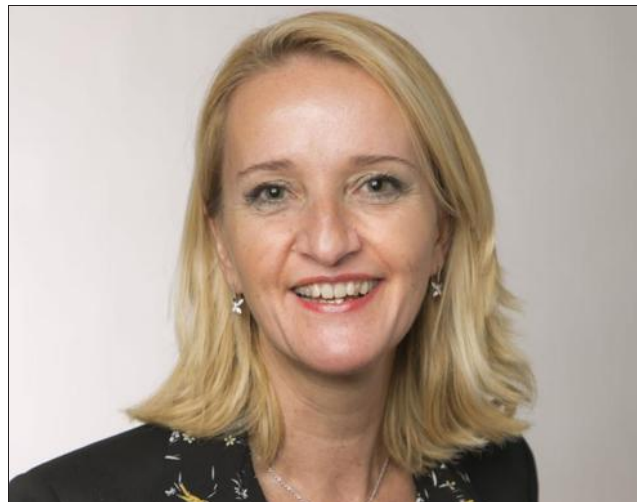
■ « En janvier 2019, nous lançons une nouvelle campagne de communication "Branchez-vous Santé®". »

« Fort de sa double expertise en santé et en retraite, c'est naturellement qu'AG2R LA MONDIALE œuvre chaque jour dans le domaine de la prévention santé, pour le bien-être et le bien vieillir. AG2R LA MONDIALE, dans son approche de la prévention santé, considère l'ensemble des mesures destinées à améliorer l'état de santé, pour parvenir à un état complet de bien-être physique, mental et