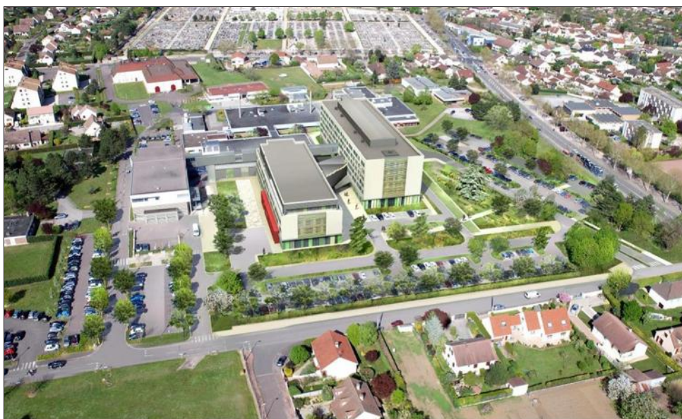
■ Au total, il accueillera 191 lits : 90 en médecine, 60 en chirurgie (10 en ambulatoire), 35 au pôle mère-enfant (dont 12 en pédiatrie), et 6 en réanimation « polyvalente ».