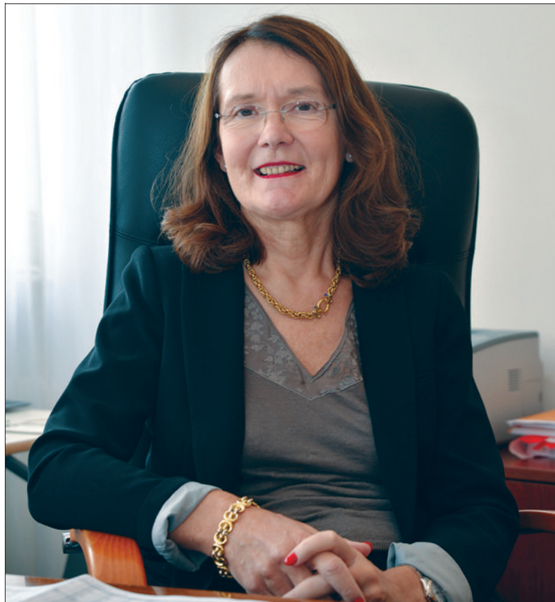
■ « La relation patient-soignant est au cœur de nos préoccupations. »

« L'endométriose est une pathologie ayant une forte prévalence et des conséquences importantes, pour le quotidien des femmes qui en souffrent. Pourtant, son diagnostic reste très long. Il nous semblait donc important de sensibiliser le grand public à cette maladie et de présenter les moyens spécifiques déployés par le CHU Dijon Bourgogne pour sa prise en charge. »