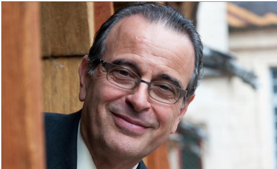
■ « Les Hospices Civils de Beaune sont pleinement inscrits dans le projet régional de santé. »

2, permettant ainsi l'accueil des naissances prématurées, la création d'un service de soins de suite et de réadaptation cardiovasculaire (SSR), l'ouverture d'un service de court séjour gériatrique, le développement des alternatives à l'hospitalisation (hôpitaux de jour, HAD), mais aussi, l'ouverture d'une consultation de la douleur, le renouvellement de notre scanner ou encore notre autorisation en cancérologie. Mais le plus important pour nous, est sans doute d'aller plus loin dans la coordination des professionnels et des associations. La responsabilité territoriale en santé se partage avec la médecine libérale, tous les acteurs libéraux de la santé et les professionnels du secteur du médico-social. C'est dans ce sens, que nous avons eu l'honneur de partager notre conférence avec le Groupement des Professionnels de Santé du Pays Beaunois lors des Journées de la Santé et que nous vous ferons connaître nos futures initiatives. »