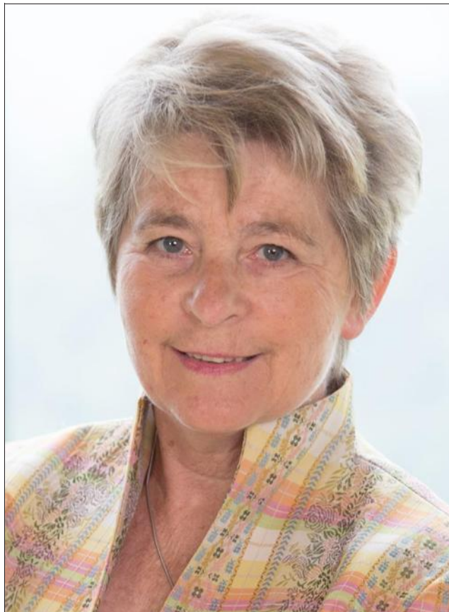
■ « Nous nous sommes engagés à réduire les inégalités d'accès aux soins. »

« Nous souhaitons récompenser une innovation pertinente dans le domaine de la santé, qu'elle porte sur un produit, une dynamique ou une technologie. Toutes ces initiatives en matière de télémédecine pourront à terme s'interconnecter avec la démarche déjà enclenchée sur le territoire, tels les projets e-TICSS ou Numérica. J'espère que cette journée de débats et de mise à l'honneur de projets novateurs créateurs de lien social démontrera qu'il existe des alternatives à l'hospitalisation, une autre prise en charge des traitements à distance, qu'une amélioration des systèmes de communication est possible et que la mutualisation des outils permettra, à terme, une meilleure prise en charge des patients. »