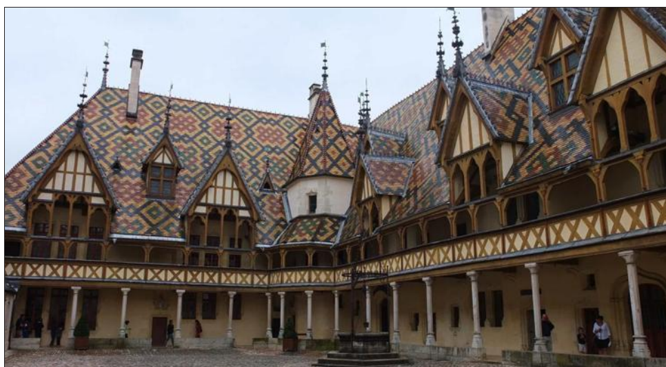
■ L'Hôtel-Dieu avec ses façades gothiques, ses toits vernissés, tapissés de figures géométriques aux couleurs flamboyantes, fait partie du patrimoine des Hospices de Beaune, institution charitable créée en 1443 par Nicolas Rolin, chancelier du Duc de Bourgogne et son épouse Guigone de Salins.