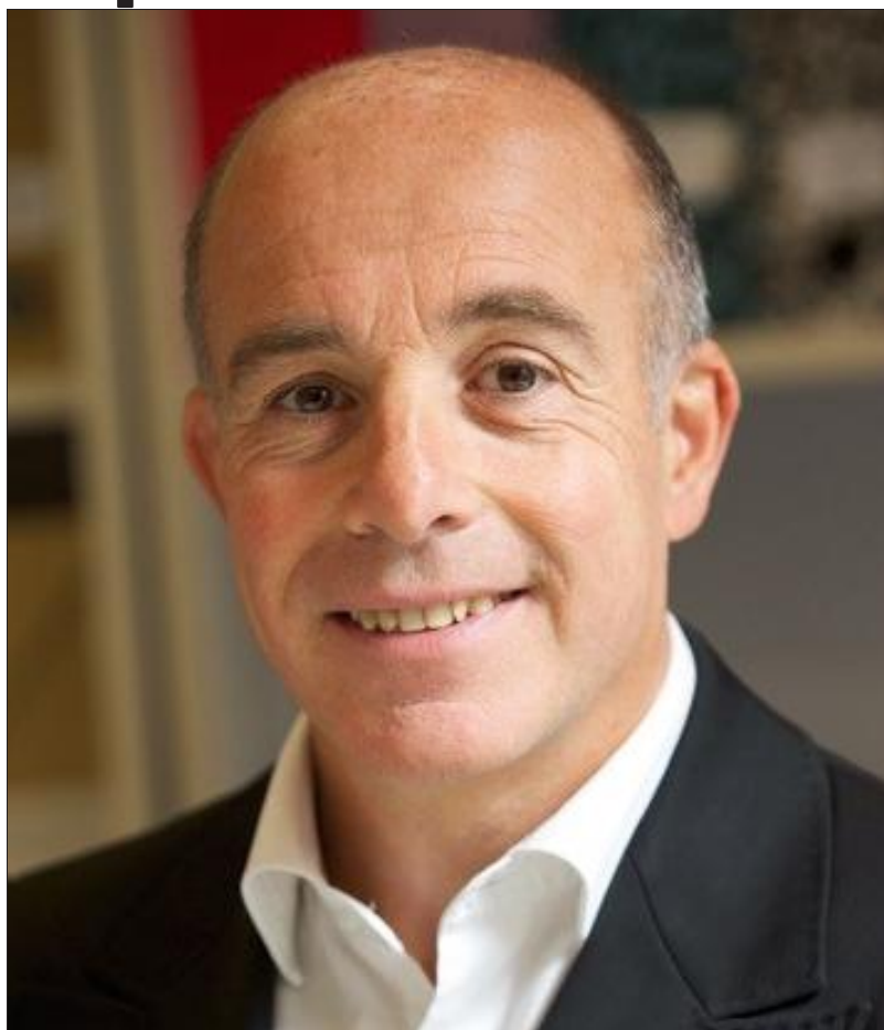
■ « Faire travailler sa mémoire est un facteur très important pour prévenir la maladie d'Alzheimer. »

les symptômes et signes précurseurs qui sont reconnaissables. Certains médecins estiment que comme l'espérance de vie augmente, le nombre de malades aussi. La maladie d'Alzheimer existe, parce qu'on a atteint un certain plafond de verre lié à notre espérance de vie qui ne cesse de s'accroître. »