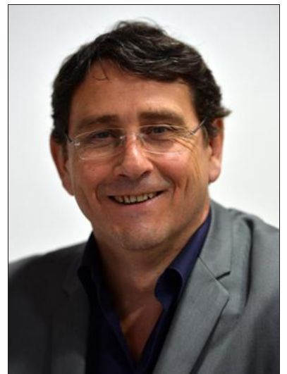
■ « Chaque conférence permettra de poser des questions aux intervenants. »

« N'étant pas un spécialiste, j'ai été surpris par la qualité des dossiers de candidature. Nous en avons d'ailleurs écartés à regret, en leur recommandant de candidater à nouveau l'année prochaine, tant ils ont interpellé les jurés. Hélas, il fallait faire un choix et la sélection établie par les experts des différents partenaires de la manifestation est vraiment remarquable, par son originalité et sa diversité. »